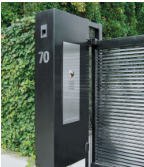
Klingel, Gegensprechanlage und Beschriftung sind auf reduzierte und hochwertige Weise in die Eingangssituation eingebettet. Edelstahl eignet sich beim Einsatz im Außenbereich besonders aufgrund seiner Korrosionsbeständigkeit und Langlebigkeit.