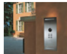
Klingeltableaus mit Gegensprech- und Überwachungsfunktion aus Edelstahl stellen einen spannenden Kontrast zu Altbauten dar.