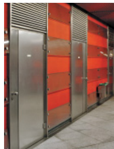
Bauherr: Landeshauptstadt München, Deutschland Architekten: U-Bahn-Referat, München, Deutschland

U-Bahnstation Josephsburg in München; trotz hoher technischer und bauphysikalischer Anforderungen werden Brandschutztüren aus Edelstahl Rostfrei auch ästhetischen Ansprüchen gerecht.