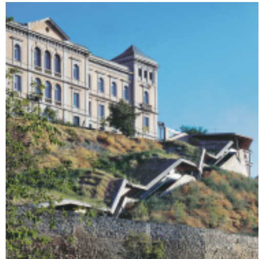
Um den Höhenunterschied von 36 Metern zu überwinden wurde die Rolltreppe, der Topographie angepasst, in sechs Abschnitte unterteilt.