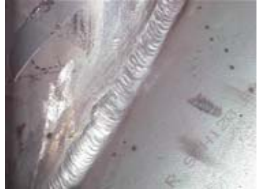
Mechanische Oberflächenbehandlung einer Schweißverbindung: Ihr Ziel liegt nicht in der Einebnung der Schweißnaht, sondern der Entfernung von Anlauffarben in ihrer Umgebung.

Anlauffarben treten insbesondere in der Wärmeeinflusszone von Schweißnähten auf, auch bei sachgerechter Schutzgasanwendung. Andere Schweißparameter wie die Vorschubgeschwindigkeit können ebenfalls die Bildung von Anlauffarben im Bereich der Schweißraupe beeinflussen.