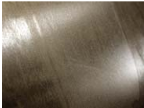
Während des Warmwalzens entsteht auf der Oberfläche nichtrostender Stähle eine schwarzgraue Oxidschicht, die werksseitig durch Entzunderung beseitigt wird.

Auch leichte Verzunderungen, z.B. nach einer Wärmebehandlung, werden zumeist durch Beizen entfernt.