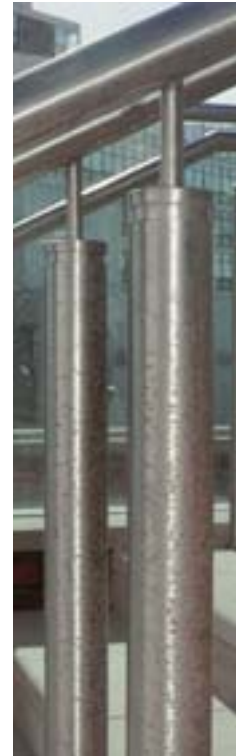
Durch Fremdeisen verunreinigte Oberfläche eines Bauteils aus nichtrostendem Stahl: aufgrund galvanischer Reaktion zwischen den beiden metallischen Werkstoffen oxidieren die Eisenpartikel beschleunigt und hinterlassen dabei Korrosionsspuren auf dem nichtrostenden Stahl.

Beratungsstellen für Edelstahlanwendung verfügen häufig über Hinweise auf Dienstleister, die auf die Entfernung von Fremdeisenverunreinigungen sowie die Wiederherstellung und Reinigung dekorativer Oberflächen spezialisiert sind.