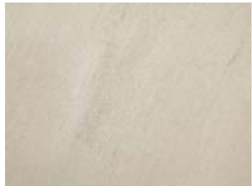
Nach dem Entzundern und Beizen ist die werksseitige Oberfläche matt grau. Die mechanische Entzunderung führt dabei zu einer Aufrauung der Oberfläche.