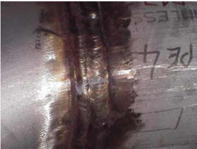
Unbehandelte Schweißverbindung: Die Zunderschicht kann Ausgangspunkt von Korrosion werden, wenn sie nicht sachgemäß entfernt wird.

Bei der Bildung von Anlauffarben auf nichtrostendem Stahl wandert Chrom an die Stahloberfläche, da es leichter oxidiert als Eisen. Dadurch entsteht eine chromverarmte Oberflächenschicht, die gegenüber dem Ausgangsmaterial eine geringere Korrosionsbeständigkeit aufweist.