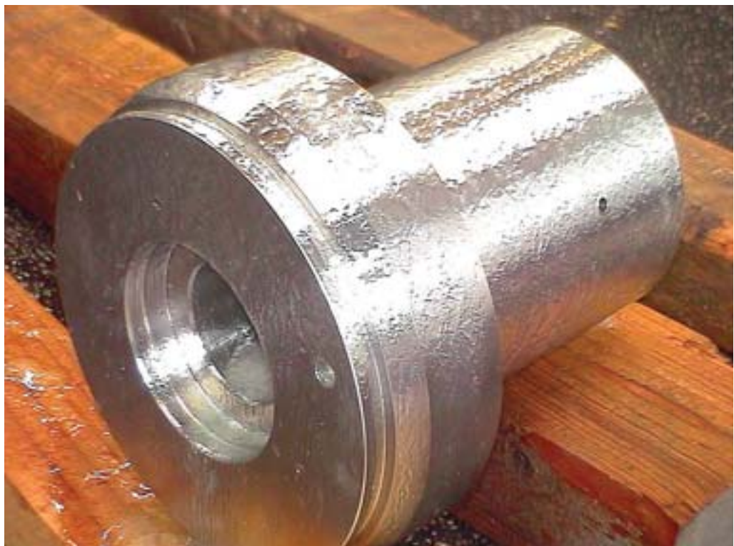
Kleine Bauteile lassen sich mit streichfähigen Beizpasten und -gels behandeln.

Die nationalen Informationsstellen für Edelmetallanwendung erteilen Auskünfte über Lieferanten von Beizprodukten und führen Listen von Beizbetrieben