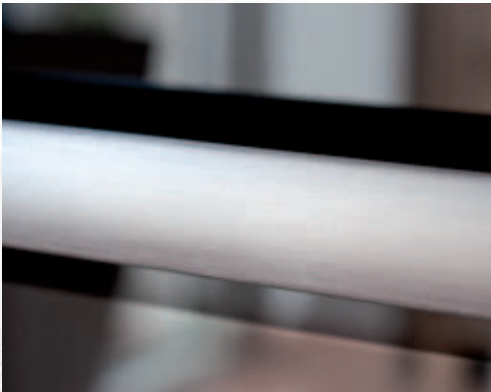
Dekorative Flächen sollten stets in Schliffrichtung gewischt werden.

Im Übrigen sind Finger Spuren zumeist ein Anfangsphänomen auf neuen Geräten. Bereits nach wenigen Reinigungsvorgängen treten sie kaum noch in Erscheinung. Die Küchenhersteller bieten auch verschiedene „Anti-Fingerprint“-Behandlungen an, die Fingerabdrücke weniger sichtbar werden lassen.