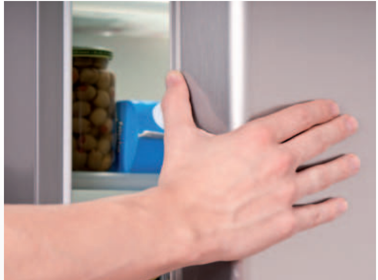
Die Haushaltsgerätehersteller bieten heute verschiedene Anti-Fingerprint-Lösungen an. Aber auch auf unbehandelten Oberflächen nimmt die Sichtbarkeit von Fingerabdrücken mit der Zeit ab.

Insbesondere in Regionen mit hartem Wasser sollten die Oberflächen anschließend trockengerieben und das Wischtuch nicht auf der Edelstahloberfläche abgelegt werden, um Kalkspuren zu vermeiden.