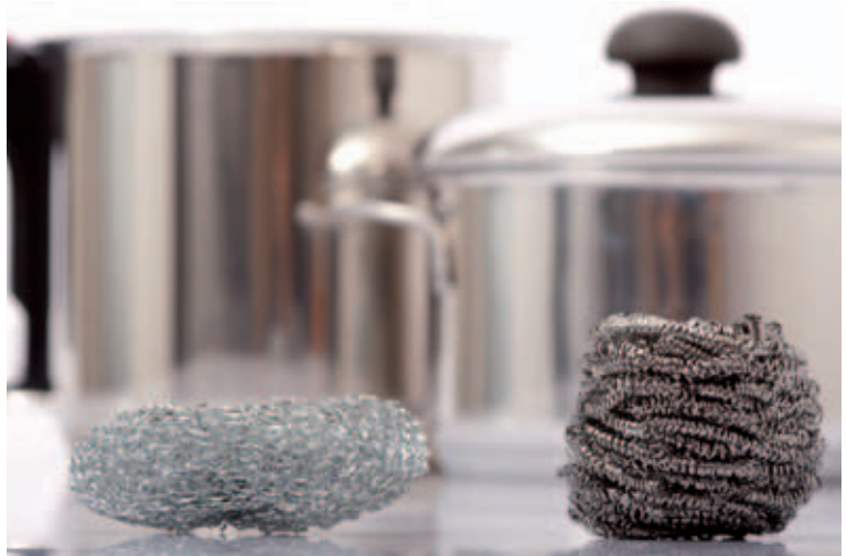
Nur Topfschwämme, die selbst aus nichtrostendem Stahl bestehen oder aus Kunststoff gefertigt sind, dürfen für Töpfe und Pfannen aus nichtrostendem Stahl eingesetzt werden, keinesfalls gewöhnliche, „schwarze“ Stahlschwämme.

Man kann sich die Arbeit wesentlich vereinfachen, wenn man zunächst den angebrannten Bodensatz einweichen lässt. Dazu einfach den Topf mit Wasser füllen, einen Tropfen Spülmittel zusetzen und 15 min einwirken lassen. Anschließend lässt sich der Ansatz zumeist leicht mit Kunststoffschwamm oder -bürste entfernen. Keinesfalls darf Stahlwolle aus gewöhnlichem Stahl benutzt werden. Sie hinterlässt auf nichtrostendem Stahl Rostspuren, die dessen Selbstreparaturmechanismus örtlich stören können.