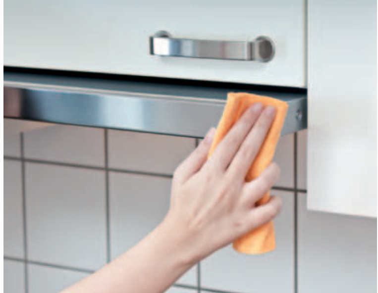
Einfaches Abwischen mit einer Spülmittellösung oder mit einem feuchten Mikrofaser Tuch reicht in der Regel für ein perfektes Reinigungsergebnis.

Für hochglanzpolierte Oberflächen eignen sich chloridfreie Glasreiniger. Zu vermeiden sind dagegen scheuernde Produkte, da sie Kratzer verursachen. Auf geschliffenen Oberflächen sollte immer in Schliffrichtung gewischt werden und nicht quer dazu.